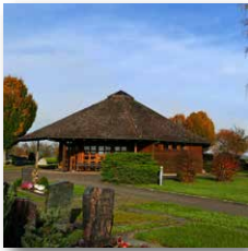
Neuer Friedhof Okenstraße 355 77652 Offenburg