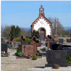
Alter Friedhof Am Alten Friedhof 2 77652 Offenburg